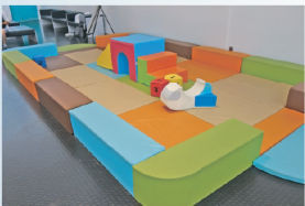
キッズルームへの抗菌