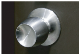
ドアノブへの抗菌