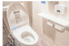
トイレへの除菌・抗菌