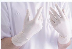
グローブへの抗菌