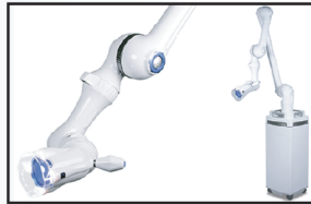
口腔外バキューム