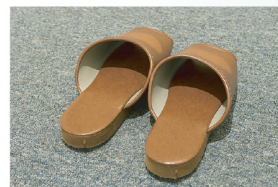
スリッパへの消臭・抗菌