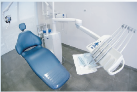
ユニットや周辺機器類