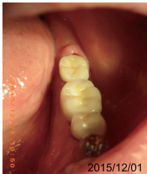
①2015/12/01 周囲炎の清掃と洗浄