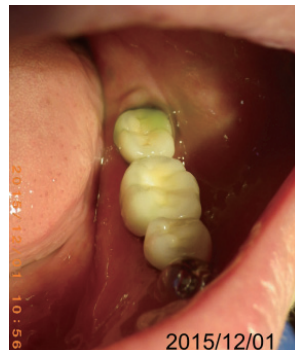
②同日 院内でケアポリスを塗布