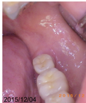
③2015/12/04 家庭で4日連続ケアポリスを塗布